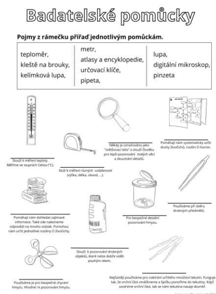
Obrázek 3 – ukázka pracovního listu pro žáka seznámení s badatelskými pomůckami (grafika a kresba Jan Závodný)