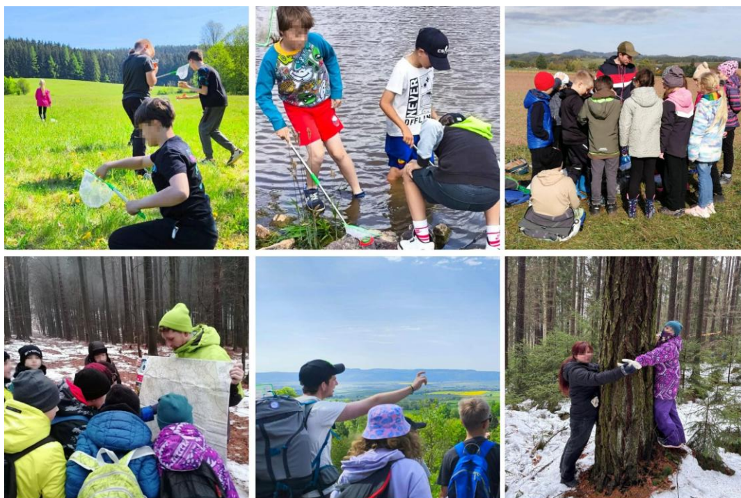
Obrázek 4 – Koláž fotografií z realizace